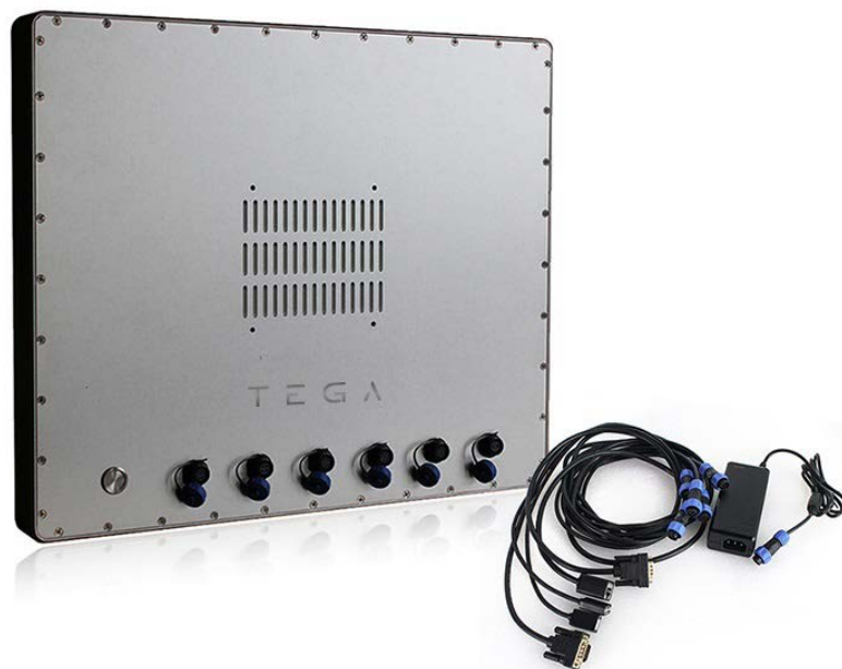
Imagen orientativa, la imagen pertenece al modelo de 19"